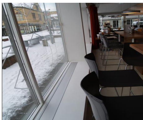
E-050 med ramme nedfelt i vinduskarm

Varmelist uten ramme festes til underlaget med tilhørende festebraketter eller borrelås, evt. felles ned på lik linje med varmelist med ramme, men det kreves da større presisjon når utsparringen lages.