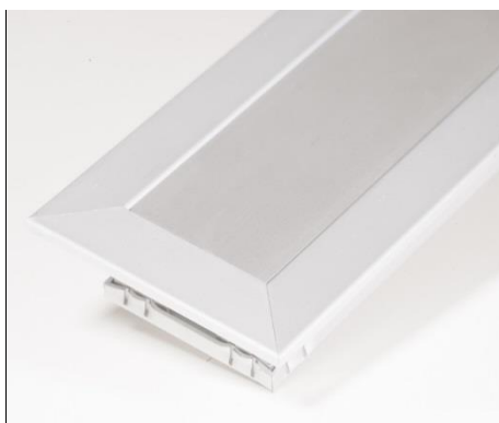
E-050 med ramme