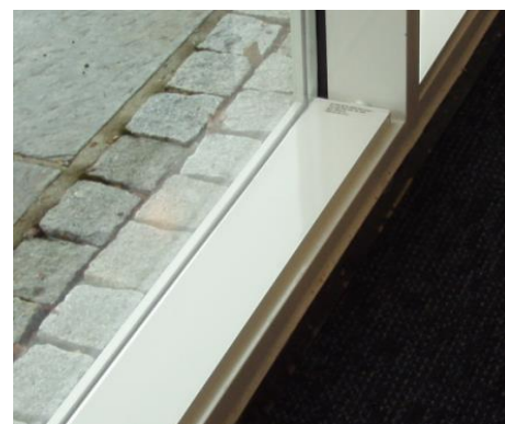
E-050 uten ramme i vinduskarm