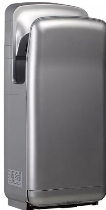
Art. nr.: HTAP-SL-1900 El-nr.: 58 662 19 GSIN-nr.: 7072395000197