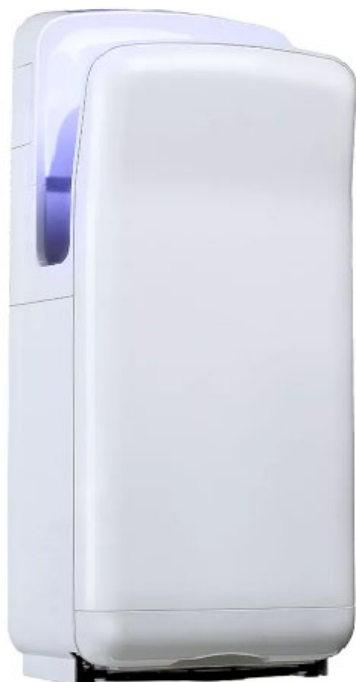
Art. nr.: HTAP-HV-1900 El-nr.: 58 662 09 GSIN-nr.: 7072395000098