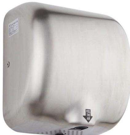
Art. nr.: HTRA-BS-1500 El-nr.: 58 662 17 GTIN-nr.: 7072395-000173