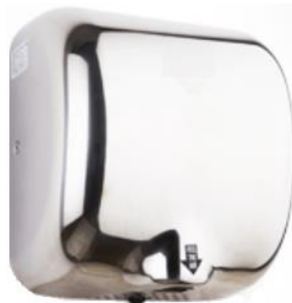
Art. nr.: HTRA-BK-1500 El-nr.: 58 662 18 GTIN-nr.: 7072395000180