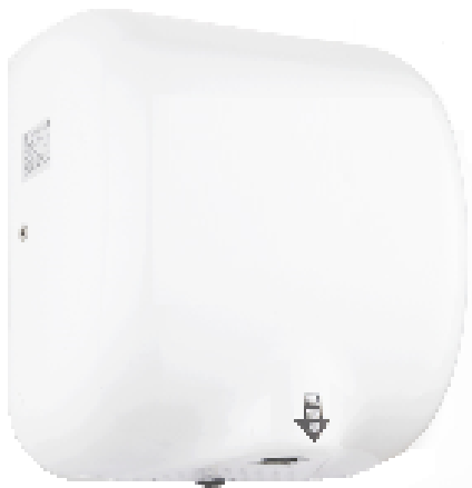
Art. nr.: HTRA-HV-1500 El-nr.: 58 662 16 GTIN-nr.: 7072395000166