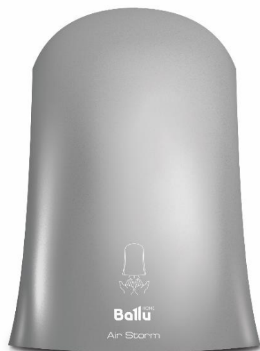
Art. nr.: HTAS-AR-1000 Farge: Antrasittgrå