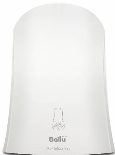
Art. nr.: HTAS-HV-1000 Farge: Hvit